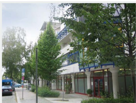
FiHH in München Physio Training Unterföhring Bahnhofstr. 16 85774 Unterföhring/München